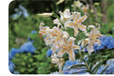
◁初夏にはヤマユリが咲き乱れます