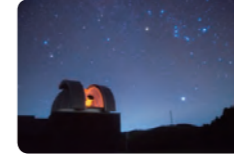
◁鹿角平の天文台までは車で3分です