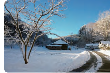
△雪が降るとしばらくの間は白銀の世界

葉貫地区は、高原の村である鮫川村のなかでもひととき標高が高く、650m前後になります。冬の時期は降雪があり、気温が0℃を超えないことも多いため、積もった雪がとけずに氷に閉ざされることも少なくありません。この時期ならではの保存食が凍み餅や凍み大根です。 夏は涼しくさわやか で、エアコンは必要ありません。水源地域のためほとんどの家は 水を山から引いており、飲むと抜群においしいです。