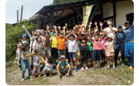
▽夏休みにはキッズキャンプが開催