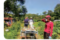
◁夏は畑も忙しい時期。湿気がないので少し休めば汗が引くような気候です