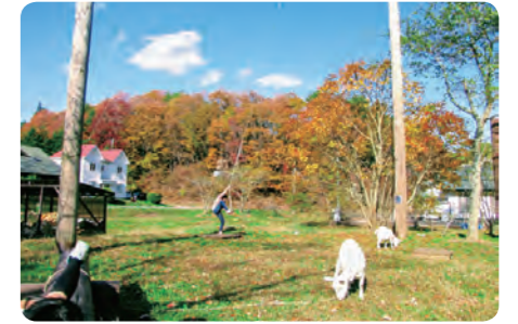
△秋には雑木林が紅葉します